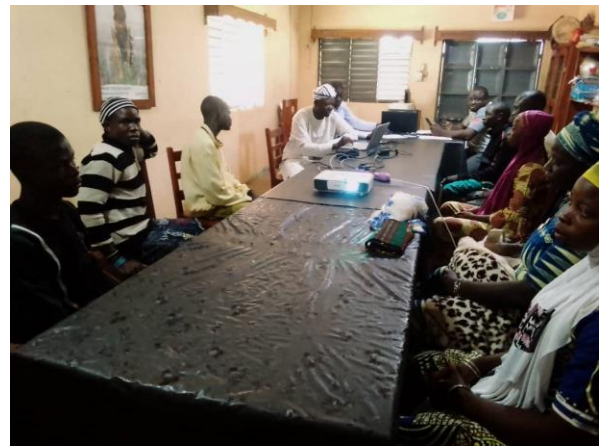
Photo : Formation des jeunes vulnérables sur l'entreprenariat et la tenue des comptes