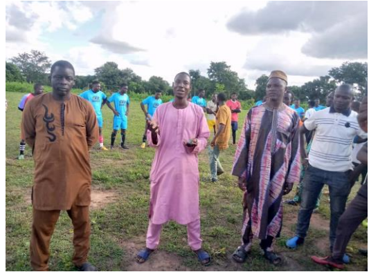
photo : sensibilisation des 22 acteurs et leurs staff sur la cohésion sociale par le Chef village de Sinangou frontière