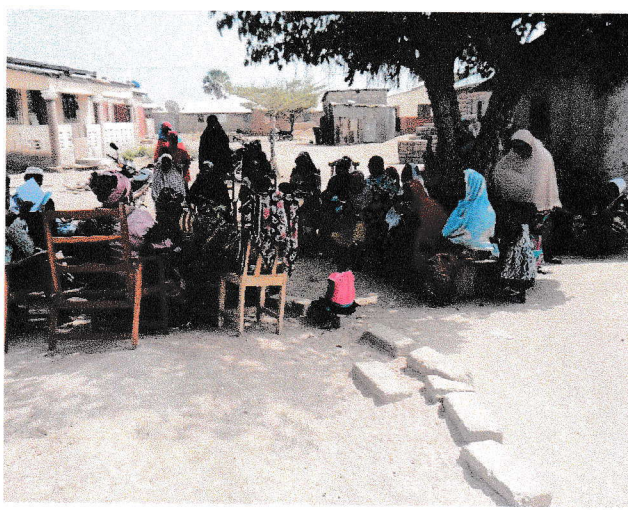
Fig 1 : Séance de sensibilisation sur les bonnes pratiques d'hygiène et d'assainissement à Gourou