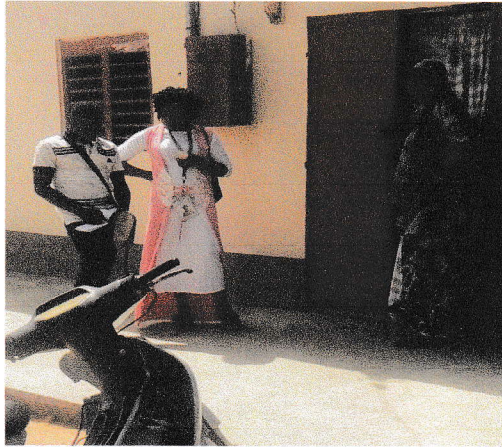
Recouvrement de redevance à Gourou