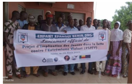
Photo : lancement officiel du projet