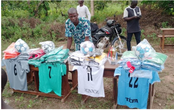
Photo : jeux de maillots des équipes participantes