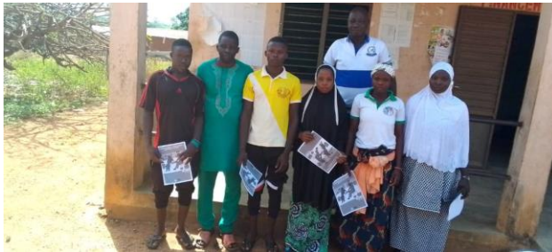
Formation des jeunes vulnérables sur une activité génératrice de revenus