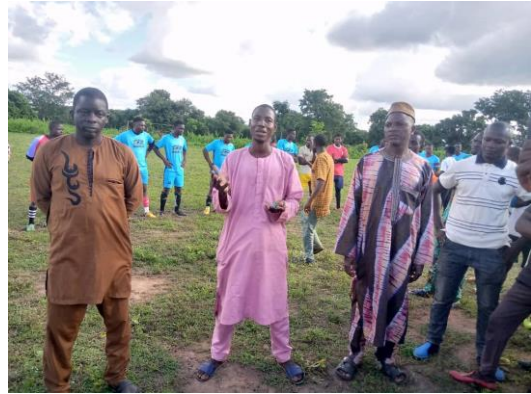
photo : sensibilisation des 22 acteurs et leurs staff sur la cohésion sociale par le Chef village de Sinangou frontière