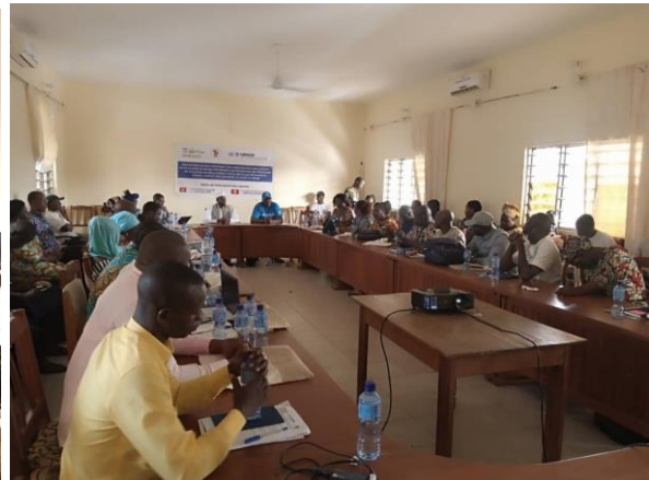
Participation d'EEB ONG à la formation des OSC sur la mise en œuvre des projets de protection des personnes en situation de déplacement forcé, réfugiés, demandeurs d'asile et des apatrides